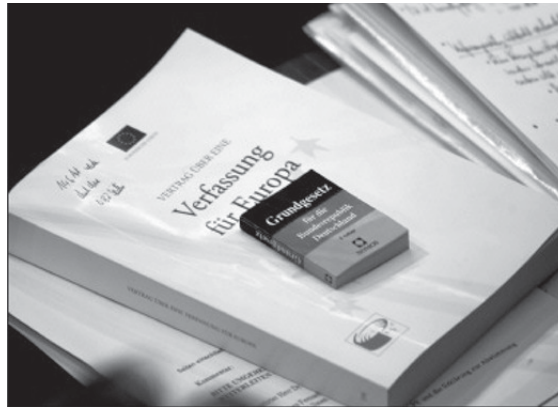
Wie David und Goliath – das Grundgesetz und die EU-Verfassung

Weiterhin wird kritisiert, daß der ungleiche Zeitpunkt der Referenden und Parlamentsratifizierungen es ermögliche es, die Ratifizierungen zum jeweils vermuteten günstigsten Zeitpunkt durchzuführen. Beispiele für gewissen Druck auf die Parlamente seien das frühe Referendum in Spanien nach entsprechend günstigen Umfragen und der Versuch, dem französischen Referendum durch das deutsche Beispiel rechtzeitig den „nötigen Schub“ zu geben. Die schnelle Ratifizierung ohne Volksbefragung in